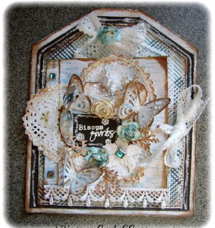
Lili pour CartoScrap

Pour finir, et rendre ma carte encore plus jolie, déposez du Stickers Glue sur le contour de la carte (sur le marron du tag intermédiaire), ainsi que le contour du rectangle avec le texte. Ajoutez-en également sur les roses, les branchages et les papillons.